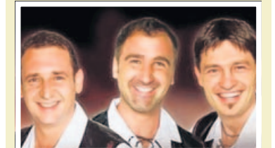
Kommen in die Hubertushalle: die „Haderlumpen“.