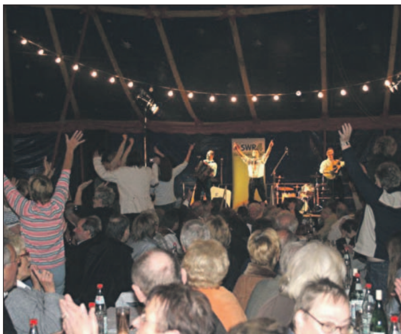
Die „Randfichten“ sorgten mit dem „Holzmittel“ dafür, dass schon frühzeitig Leben ins Obersimter Zirkuszelt kam.

Duo aus Österreich mit „Komm lass uns glücklich sein“ und anderen rhythmusbetonten Schlagern. Und weiter ging es am „Abend der schönen Namen und Schlager“, wie es Pleyer treffend formulierte. Irena hieß die nächste Sängerin. Die Xantenerin coverte unter anderem den Bonny-Tyler-Hit „Lost In France“; ihre Version hieß „Ich hab Dich verloren“. Dann kam, sah und sang der „Anton aus Tirol“, und zwar nicht nur gewichts-, sondern auch stimmungsgewaltig. „Die Hände zum Himmel“, „Blonder Engel“ und „Ave Maria der Berge“, waren nur einige seiner Hits, bei denen das Publikum gleicher Vers und Refrain mitsang. (elim)