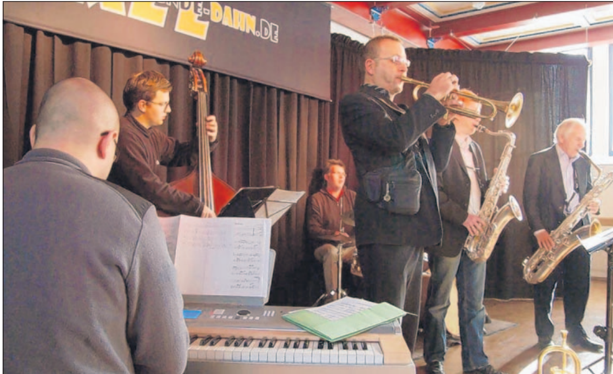
Mit einem musikalischen Leckerbissen haben die Dahner Jazz-Freunde ihre Konzertsaison eröffnet.