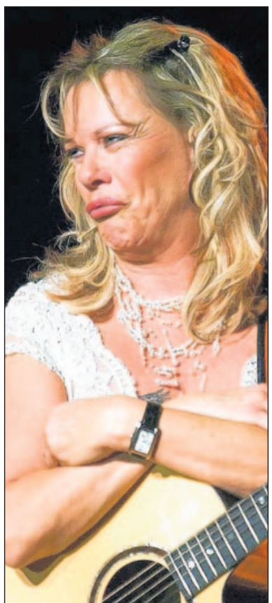
Mit Wortgewalt begeistert Lisa Fitz ihr Publikum.

Im ersten Teil noch wie ein verschüchterter Schulchor wirkend, taut das Publikum im zweiten Teil sichtlich auf, singt laut mit bei den Liedern, die die Fitz im Western-Outfit