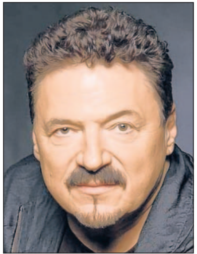
Bobby Kimball steht als Gründungsmitglied von „Toto“ für Hits wie „Africa“ und „Hold The Line“.

Bobby Kimball, Lou Gramm und Dan McCafferty heute bei „Rock meets Classic“