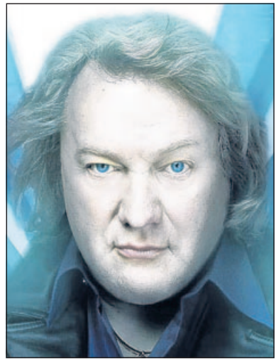
Lou Gramm war Sänger der Band „Foreigner“, als die ihre größten Erfolge hatte.

Die Bands „Foreigner“, „Toto“ und „Nazareth“ haben zusammen über 160 Millionen Alben verkauft. Ihre Hits haben die 70er und 80er Jahre musikalisch geprägt und sind zu Rock-Klassikern geworden. Nun sind die Originalsänger der Bands erstmals gemeinsam unter dem Motto „Rock meets Classic“ auf Tour – erste Station ist heute ab 20 Uhr die Saarbrücker Saarländhalle.