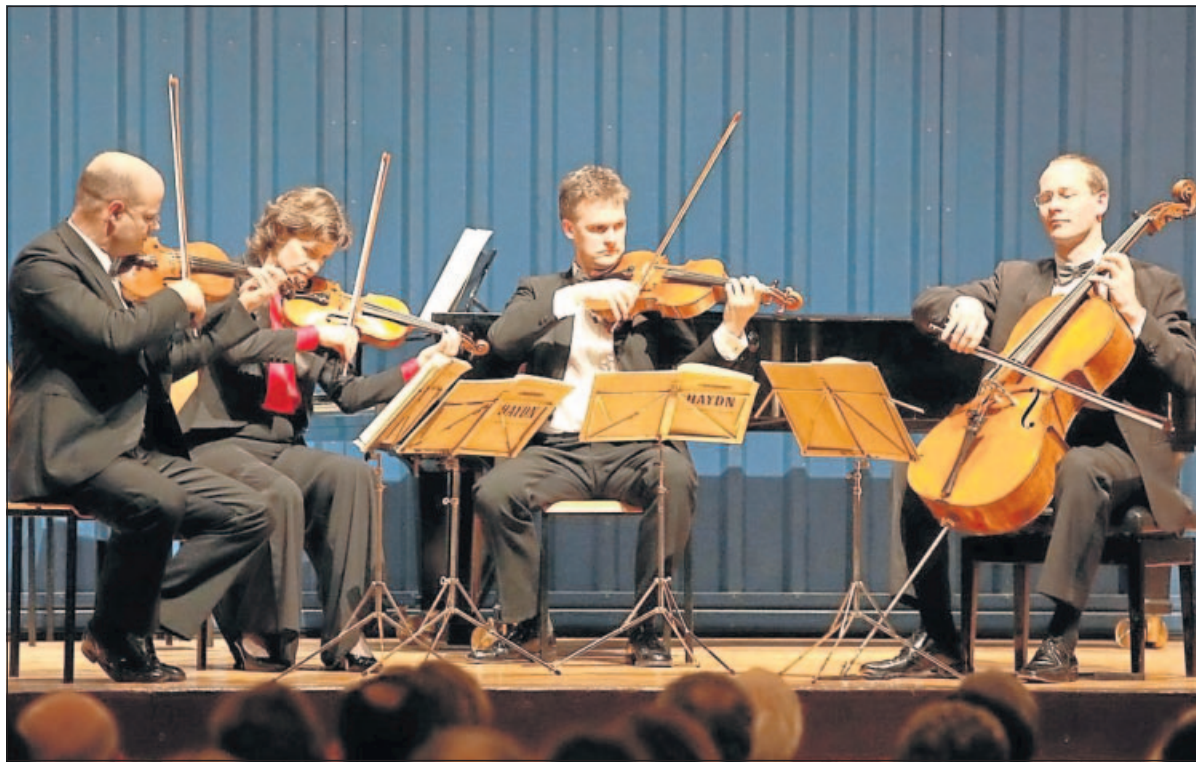
Das Mandelring-Quartett bot den wenigen Zuhörern in der Festhalle einen exzellenten Kammermusikabend.