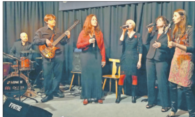
„OOYAAH“ bietet eine selten zu hörende Kombination aus vier Frauenstimmen, Bass und Schlagzeug.

Wie so oft sollte man auch bei „OOYAAH“ das Etikett „Jazz“ eher im Sinne einer speziellen Spielhaltung, denn als spezifische Genre-Zuordnung verstehen. Die Chorsätze und der Groove stammen überwiegend aus den Jazz-Konventionen, genauso wie die Fähigkeit, ein vom Publikum zugeordnetes Motiv in eine schlüssige und tragfähige Improvisation zu überführen. Mit Ausnahme der Jorge-Ben-Komposition „Mas Que Nada“, die vor allem durch Sergio Mendez populär gemacht worden ist, findet sich kaum ein Titel aus dem kanonisierten Standard-Spiel-