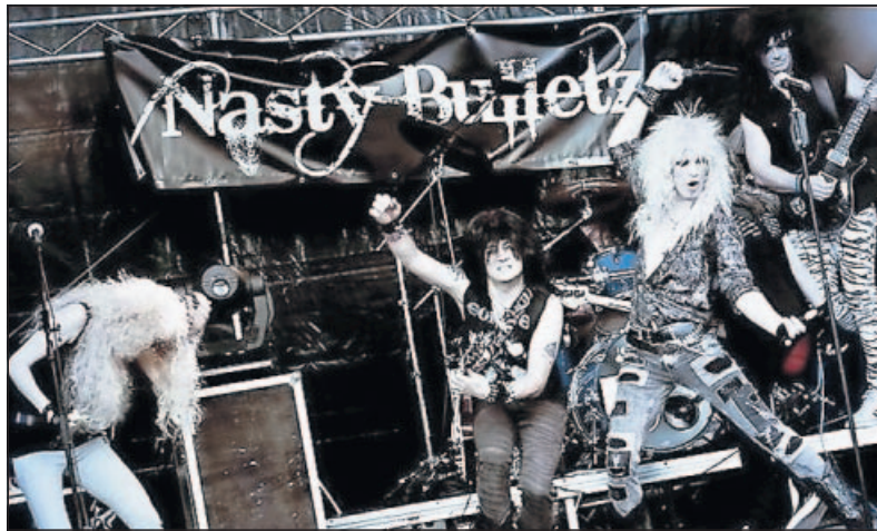
Mit ihren toupierten Haaren, engen Hosen und auch musikalisch erinnern „Nasty Bulletz“ an die 80er Jahre.

adss die „Nasty Bulletz“ das bunteste Jahrzehnt des Rock wieder aufleben lassen. Sie feiern den Hair-Metal der 80er Jahre, und das nicht nur mit lauten Marshall-Amps und bunten Gitarren, sondern stilecht mit hochtou-